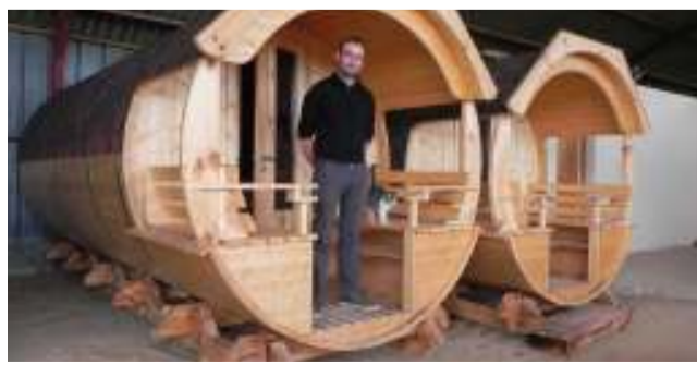
Les tonneaux sont prêts depuis ce mois de mars. ■ M.SP.