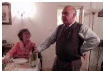
Les Anversois à Mâcon.