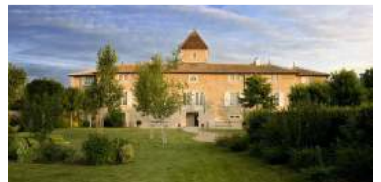
Pour impressionner madame...